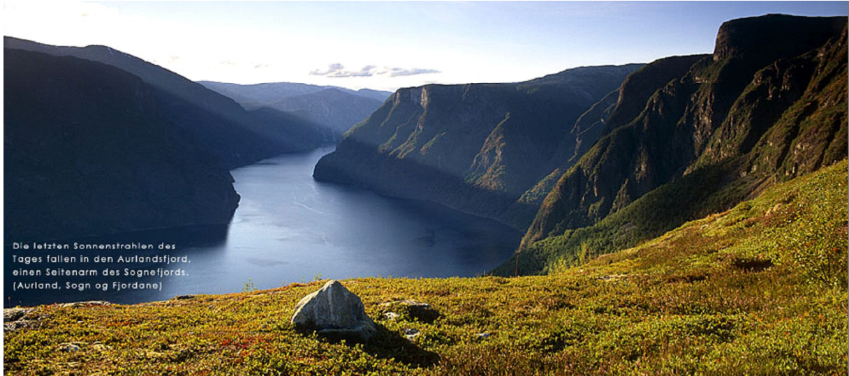
Die letzten Sonnenstrahlen des Tages fallen in den Aurlandsfjord, einen Seitenarm des Sognefjords. (Aurland, Sogn og Fjordane)