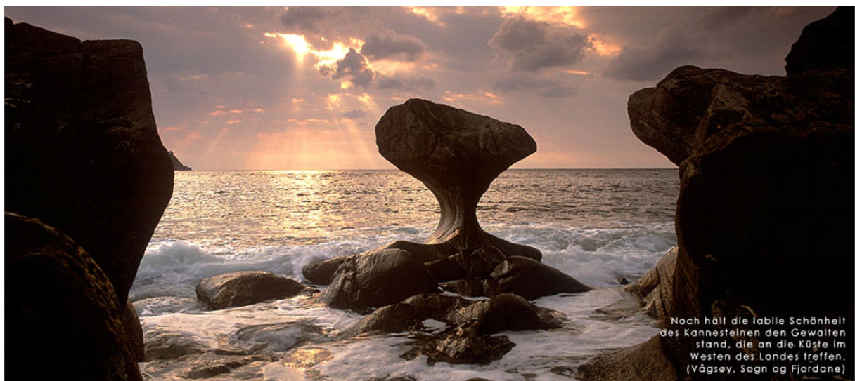
Nach hält die labile Schönheit des Kannesteiens den Gewaltstand, die an die Küste im Westen des Landes treffen. (Vågøy, Sogn og Fjordane)